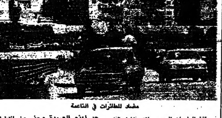
مخيم الطرقات في الناعمة